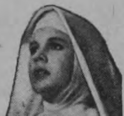
¡La más poderosa historia de fé de nuestro tiempo!

¡Singular EXITO DE UNA GRANDE Y ORIGINAL PELICULA! ¡MARAVILLOSA!