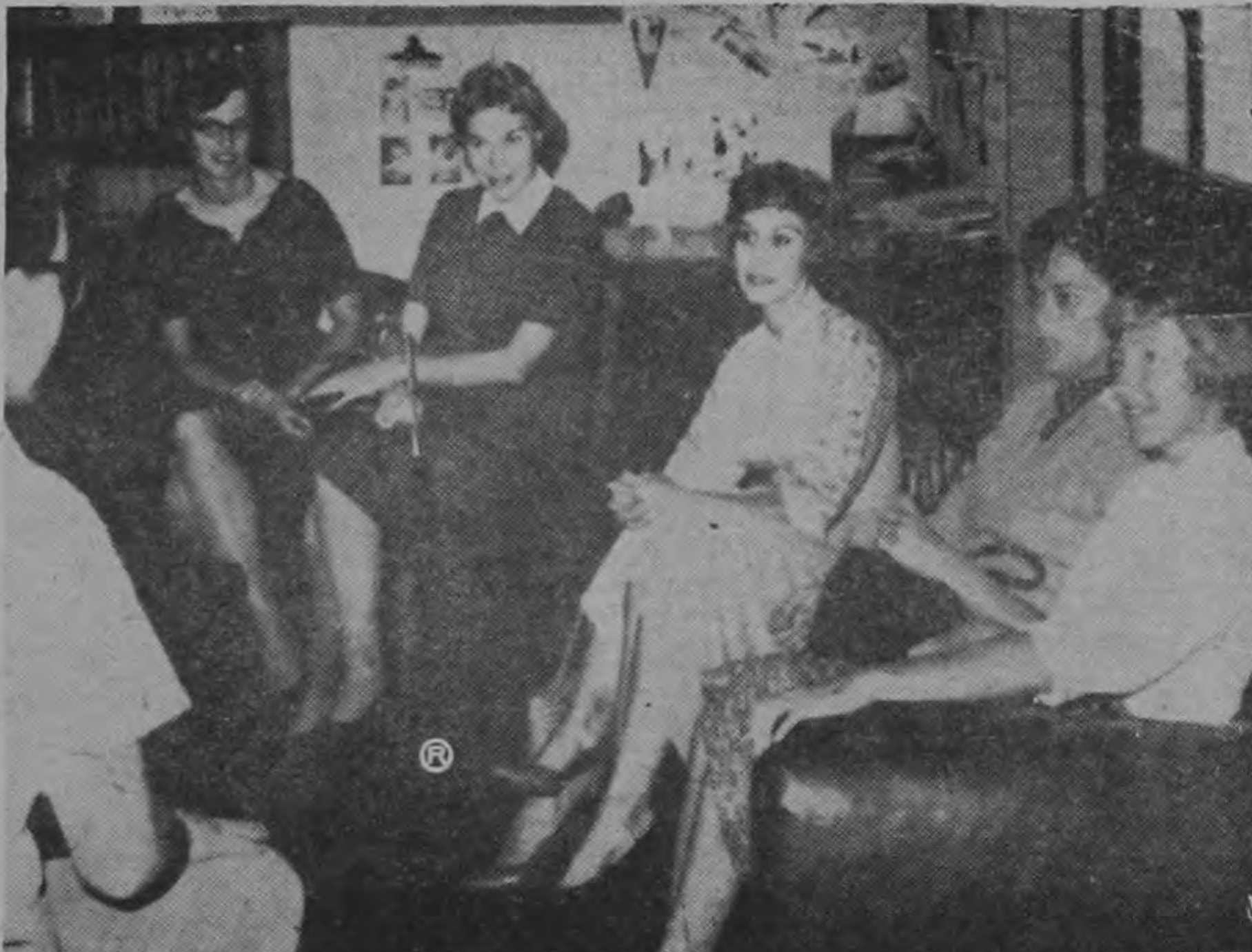
Uno de los comités del U. S. A. International Women's Club que se interesa por el conocimiento de diversas actividades de la vida costarricense como prensa, legislatura, artes, industrias visitó ayer tarde nuestras oficinas.